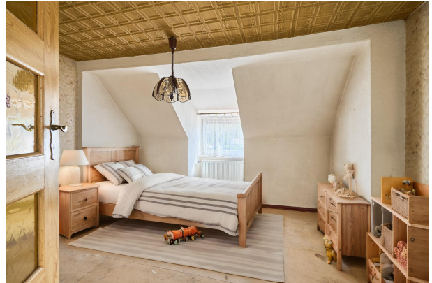
Wohnbeispiel Kinderzimmer 1 im Obergeschoss