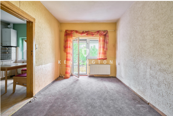
Zimmer im Erdgeschoss