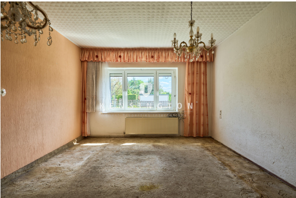
Zimmer im Erdgeschoss