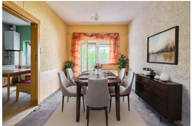
Esszimmer zur Terrasse 2