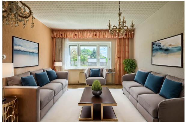
Wohnbeispiel Wohnzimmer im Erdgeschoss