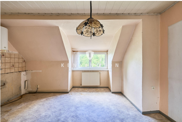
Wohnküche alt - zukünftig Bad neu?