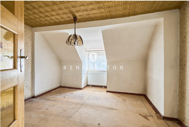
Kinderzimmer 1 im Obergeschoss