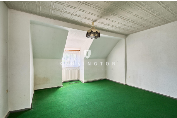
Kinderzimmer 2 im Obergeschoss