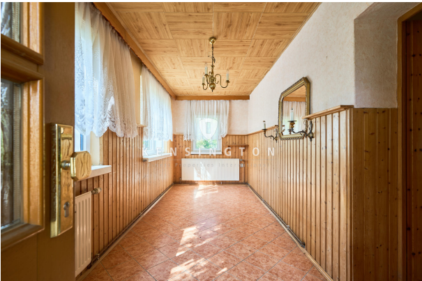
Eingang - Windfang