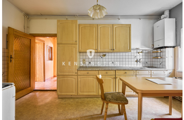
Wohnküche im Erdgeschoss