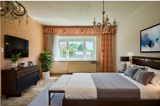
Wohnbeispiel Schlafzimmer im Erdgeschoss