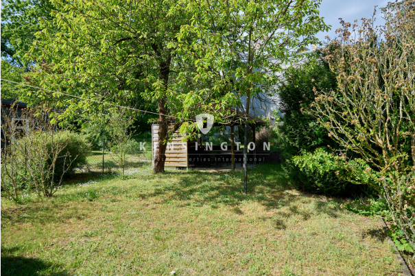
Platz für die ganze Familie