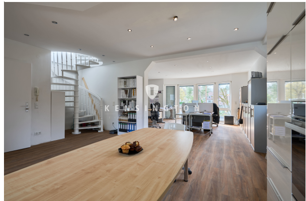
Blick in den Wohnbereich