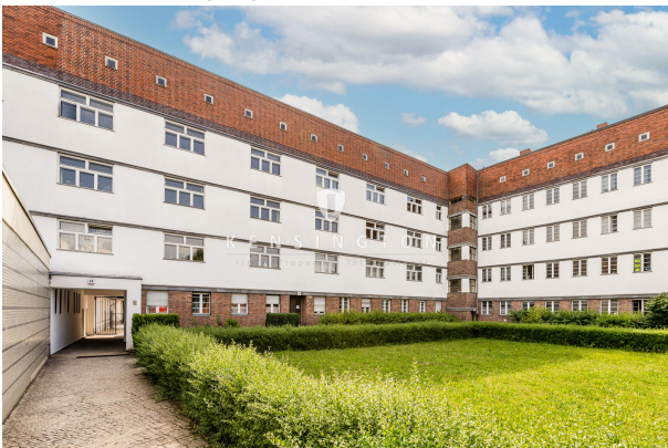
Hof- und Gartenansicht