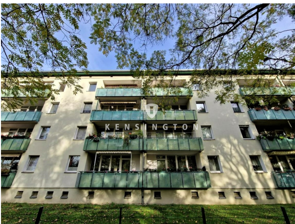
Wohnhaus Südansicht I