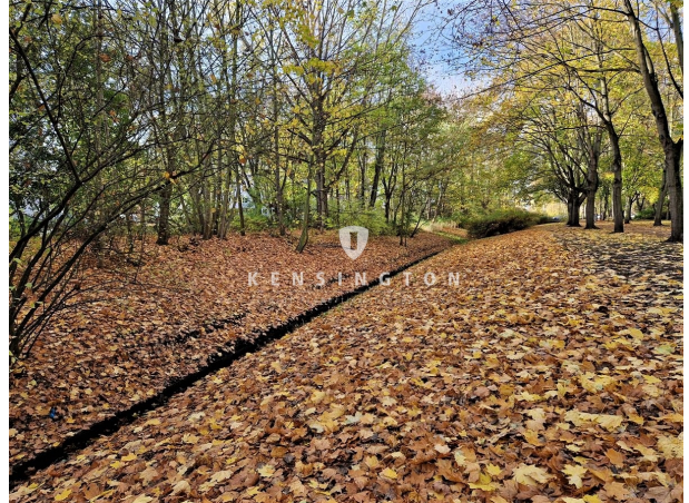
Grünanlage am Kraatz-Tränke-Graben