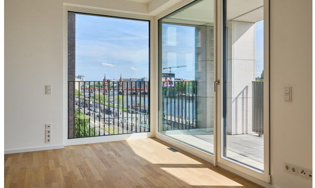
Spektakulärer Blick mit Zugang zu einer der beiden Terrassen