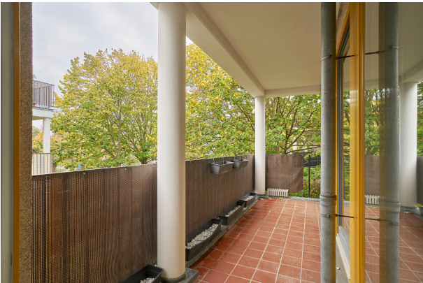
Attraktive Terrasse für die schönen Sommertage