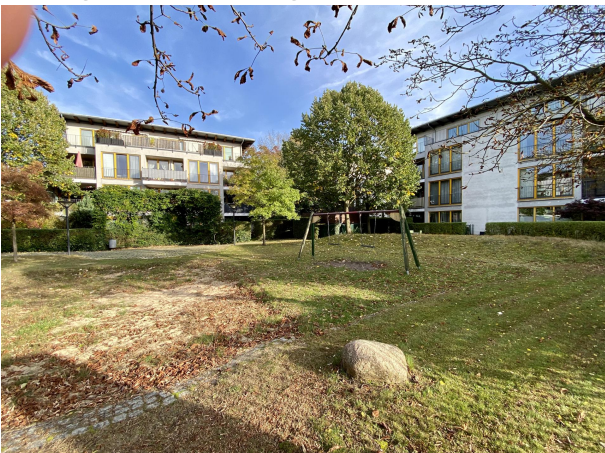
Gepflegter Gemeinschaftsgarten mit Spielplatz