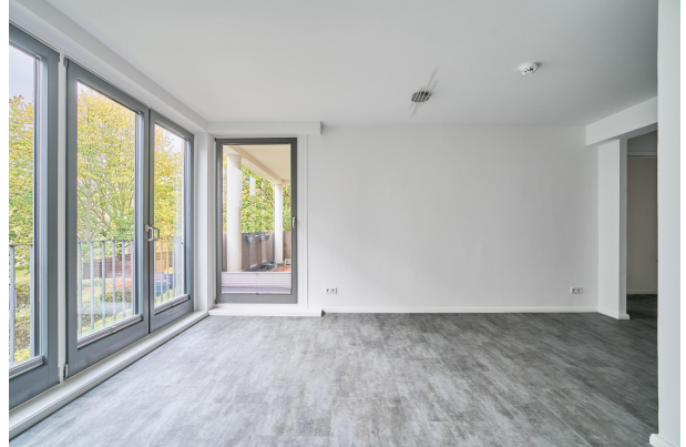
Wohn- Essbereich mit Zugang zur Terrasse