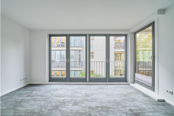
Wohn- Essbereich mit vielen Gestaltungsmöglichkeiten