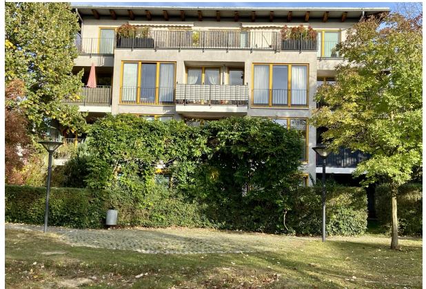
Fünf Wohngebäude eingebettet in einer gepflegten Gartenlandschaft