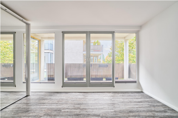
Schlafzimmer mit Zugang zur Terrasse