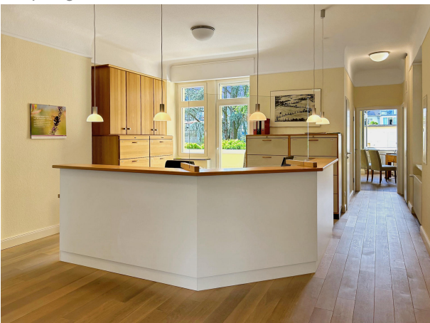
Büroraum mit Balkon