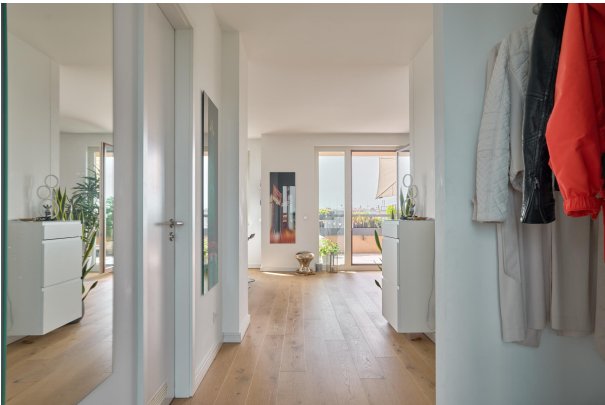
Reinkommen und wohlfühlen