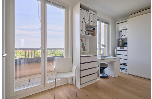
Arbeitszimmer, nutzbar als Kinderzimmer