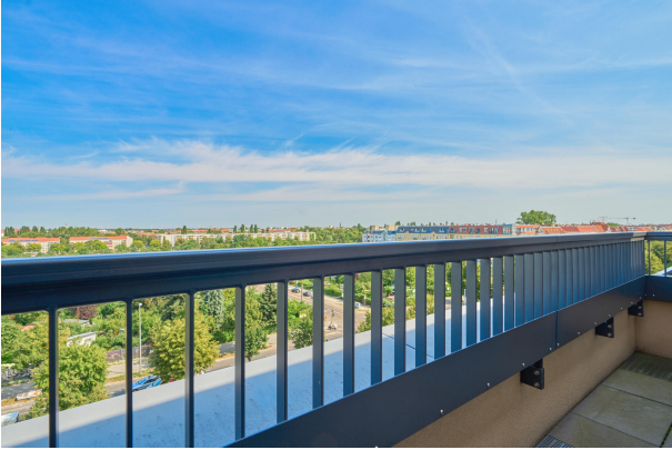
Freier Blick Richtung Norden