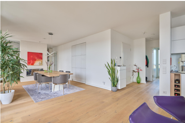
Großzügige Licht - und Raumverhältnisse