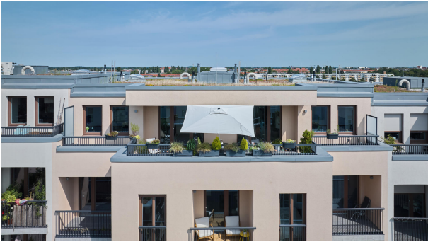
Erhöhtes Grundstück ermöglicht tolle Aussicht