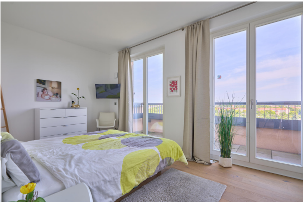
Schlafzimmer mit Schallschutzverglasung