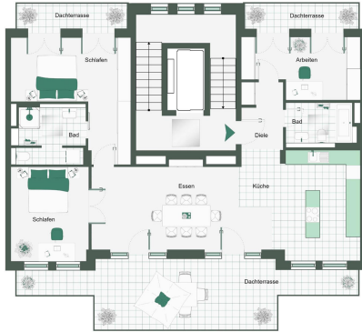
Möglicher 4-Zimmer Grundriss