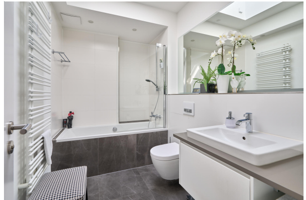
Gästebad mit Wanne