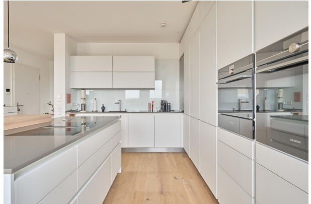
Arbeitsplatten aus Glas