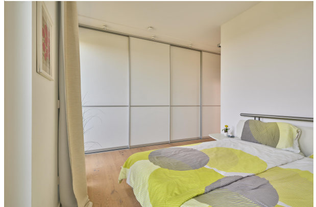
Smarte Lösungen für mehr Stauraum