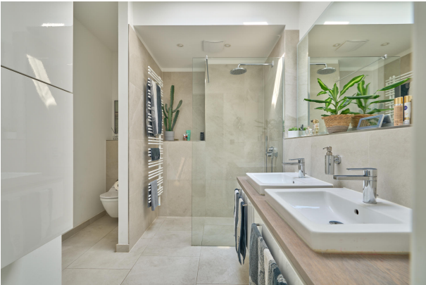
Bad en suite