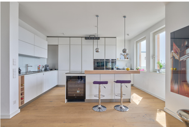
Hochwertige EBK mit voller Markenausstattung