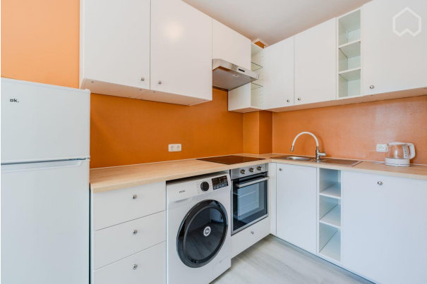
Küche mit Einbauküche